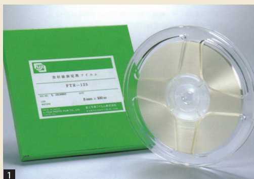
1 CTA(三酢酸セルロース)線量計を開発 (富士写真フィルム(株)と共同)【56年5月18日】