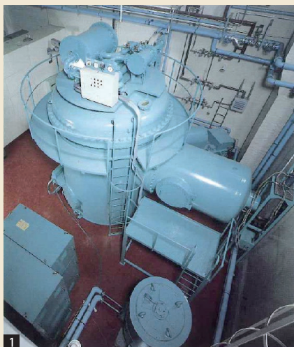
1 更新1号加速器設置【56年1月9日】