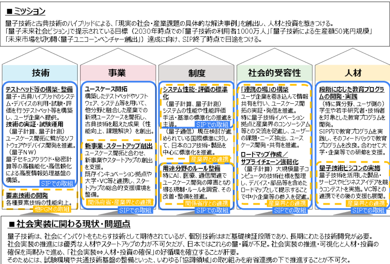
図4 5つの視点での取り組み

本課題のミッション到達に向けた各サブ課題における5つの視点の取り組みを図4に示します。なお、本課題としての各レベルの詳細については、本課題に係る研究開発計画書をご参照ください。