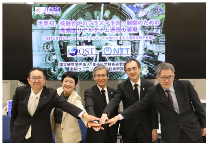
プレスリリース当日の デモンストレーション