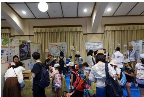
イベント中の様子