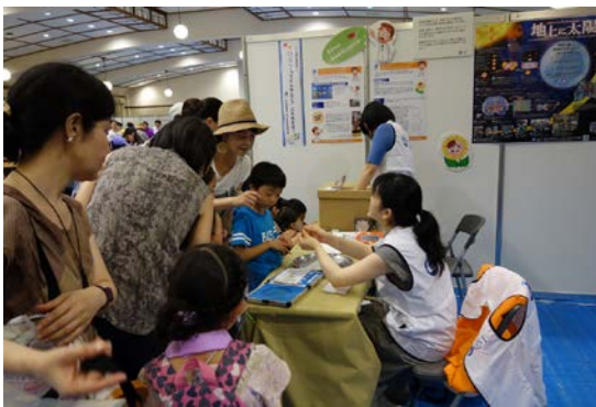
人工ダイヤモンド等を用いた実験コーナー