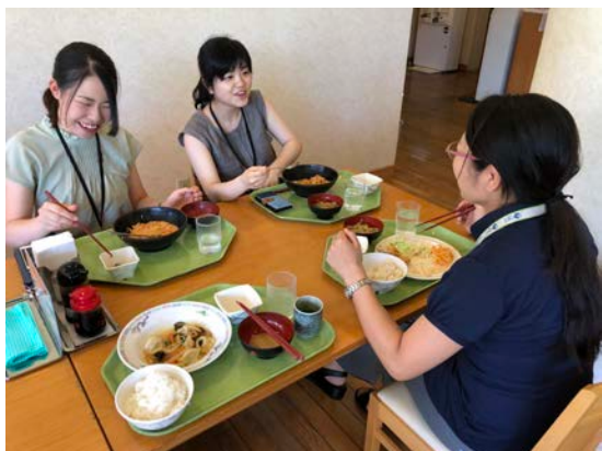
イノベーションセンターの方々とお昼休憩