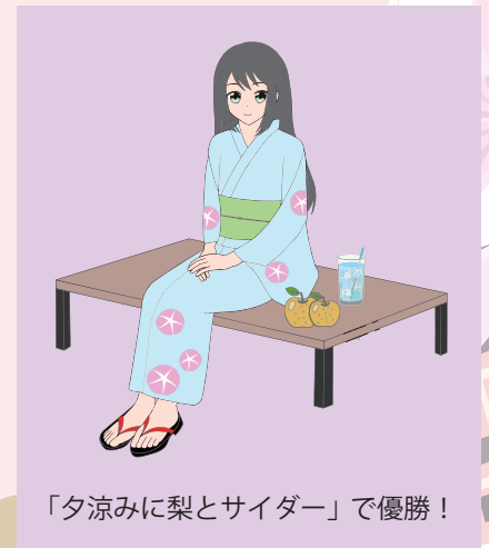
「夕涼みに梨とサイダー」で優勝！

新しいことばが作られることもあれば、「優勝」のように意味が加わったり、また外来語など他の言語から単語を借りたりすることもあります。また、全く新しく言語が生まれることもあります。ことばは常に変化するものですから、どんな変化があるか楽しんでみてください。