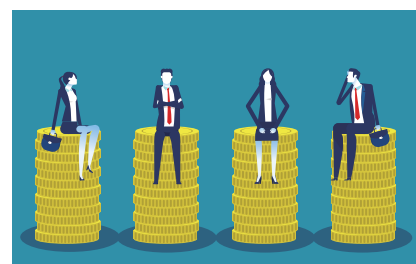
一律に現金が給付されるベーシックインカム

賃金補填として実験的に導入したフィンランドでは、給付を受けた人たちの精神的な健康は増したとする結果をまとめた一方、その本当の意味や効果は分からないと批判も出ているようだ。スイスは導入を断念したが、スペイン、ブラジルその他、アメリカや韓国などは低所得者を対象に導入されている。もし、日本で導入されたら、子育てがしやすく人口減少、経済縮小に歯止めがかかるかもしれない。また、最低所得保障があることで新しいことにチャレンジしやすくなる、住みやすい地方へ人が移動して地方活性化に繋がるかもしれない。反対に、給付金で入院生活、治療費等の突発的な大きな支出を賄えなくなるのかと考えると不安もある。社会保障制度を一部残した制度設計が理想的であると思う。