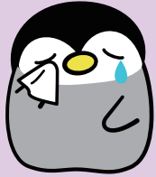
「ぴえん」とは泣いている様を表す擬態語

まず、ことばがちがう、といったときに英語やフランス語のような違う言語を思い浮かべる方、また一方で、日本語の中でも方言など、同じ言語内でもことばが違ふと考える方もいるかと思ひます。